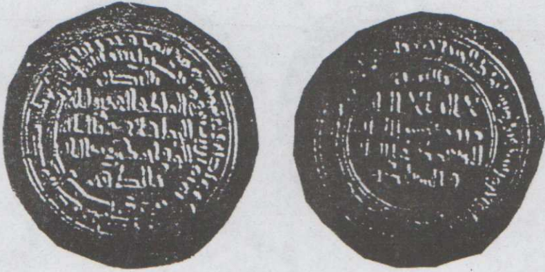
لوحة (٢) درهم باسم أحمد بن عبد الله الفجستاني ضرب نيسابور سنة ٢٦٨هـ، محفوظ بإحدى المجموعات الخاصة بالرياض، لم يسبق نشره، الوزن : ٦,٤٢ مم القطر: ٢٩,٥ مم.