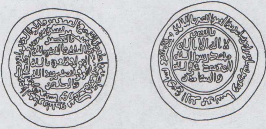
رسم توضيحي لكتابات الدرهم العلوي.