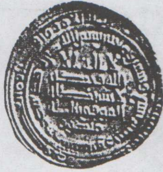
لوحه (٥) درهم صفارى باسم عمرو بن الليث وأبى طلحة منصور ضرب نيسابور سنة ٢٦٩هـ، محفوظ بإحدى المجموعات الخاصة بالرياض، لم يسبق نشره، للوزن: ٤,٢٥م القطر : ٢٧م.