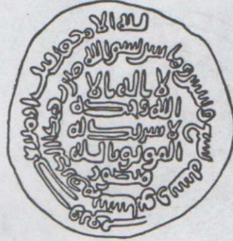
رسم توضيحي لكتابات الدرهم العلى.