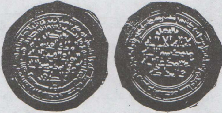
لوحه (١) درهم باسم أحمد بن عبد الله الخجستاني ضرب نيسابور سنة ٢٦٨ هـ، محفوظ بمتحف قطر الوطني . نقلًا عن : عاطف منصور: الكتابات غير القرآنية علي السكة في شرق العالم الإسلامي، مسلسل ٦٠.