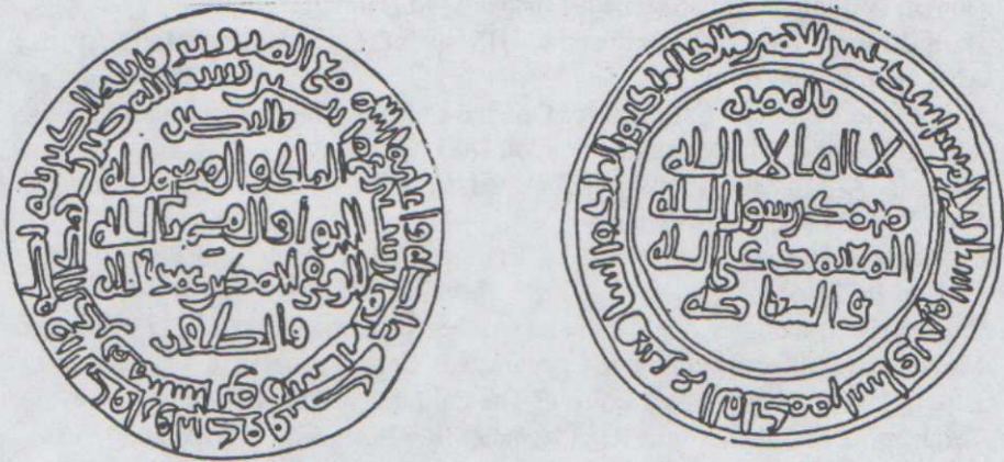
رسم توضيحي لكتابات الدرهم العلى.