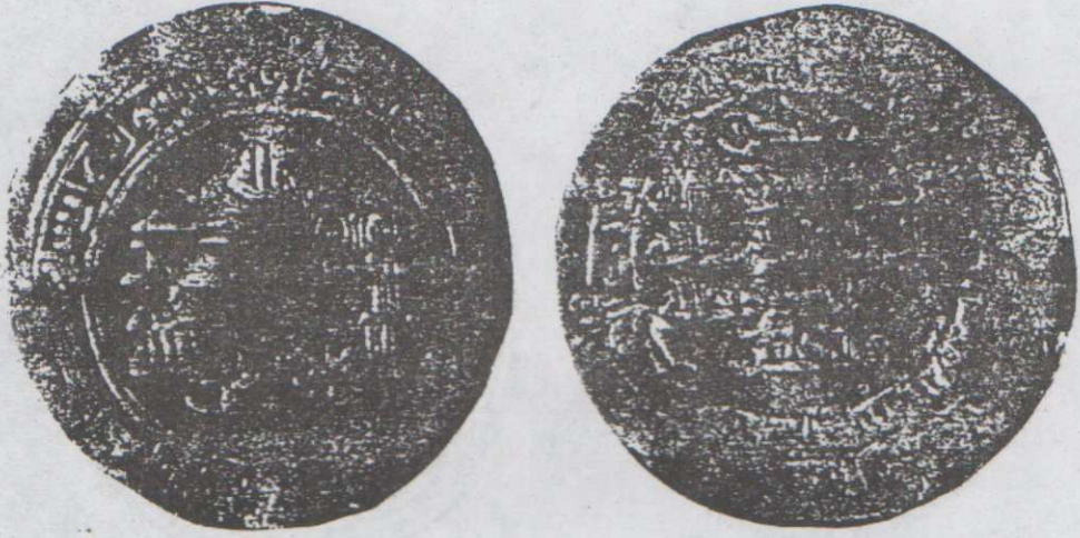
لوحه (٦) درهم باسم أحمد بن عبد الله الخجستاني ضرب هراة سنة ٢٦٨هـ مطروقة بمتحف الفن الإسلامي بالقاهرة، رقم السجل ٥ / ١٦٨٩٤ - لهيئة بفتشيرة، الوزن ٢.٥٥ جم، القطر : ٢٦ مم.