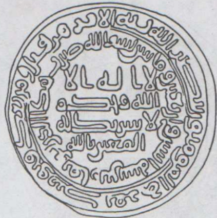
رسم توضيحي لكتابات الدرهم العلوي.