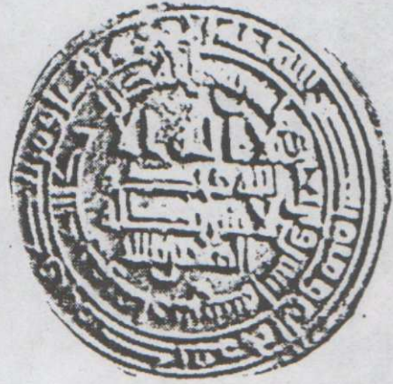
لوحة (٧) درهم عباسي باسم الخليفة المتوكل على الله ضرب مارس سنة ٢٤٢ هـ. محفوظ بإحدى المجموعات الخاصة بالرياض، لم يسبق نشره الوزن: ٢,٩٥م : القطر : ٢٥م.