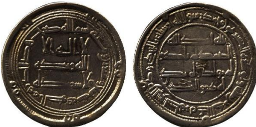
Baldwin 22 lot 3084