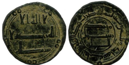
Wilkes 5 lot 50

85- al-Samiya 131, Fals OO OO OO OO OO Marwan II 127-132 Yazid b. 'Umar 128-132