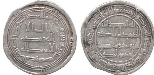
Baldwin 26 lot 104