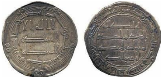
Baldwin 16 lot 166

81- Wasit 132, Dirham OO OO OO OO OO Marwan II 127-132 Yazid b. 'Umar 128-132