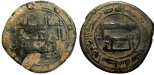
Al-Halabi & Shareef col.

73- Wasit 127, Fals O O O O O O O Ibrahim 126-127 / Rebel 127-129 'Abd Allah b. 'Umar 126-129