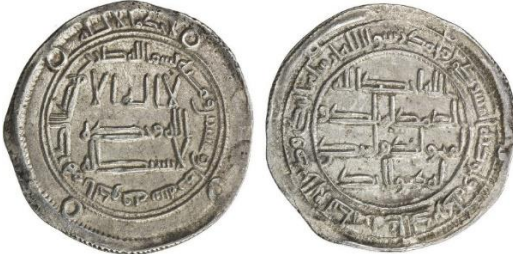
Steph. 34 lot 310